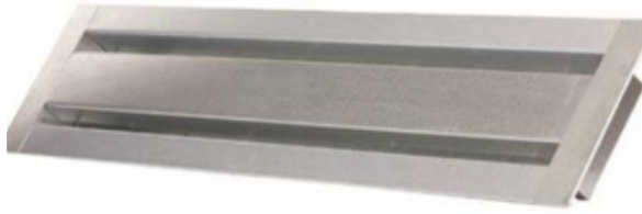
REJILLA DE VENTILACIÓN DE SOFITO RESISTENTE AL FUEGO

Las cubiertas de ventilación resistentes a las brasas están diseñadas específicamente con panales o patrones en forma de serpiente para evitar que las brasas entren en el sistema de ventilación. Hay un flujo de aire adecuado debido a la tecnología única detrás de la ventilación. Estas cubiertas están probadas y son resistentes al fuego.